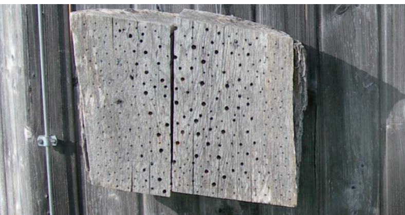
Nisthilfe für Insekten

Natürlich sind die Berater zur Verschwiegenheit verpflichtet. Die DQS ist als unabhängiger Zertifizierer in das Programm eingebunden, um die korrekte Vorgehensweise zu gewährleisten und gegebenenfalls auch eine Konformitätsbescheinigung auszustellen. Diese bestätigt, dass das Umweltmanagement des Clubs in Anlehnung an die ISO 14001 implementiert wurde und dass der Club grundsätzliche Anforderungen dieser Norm an Planung, Ausführung, Überprüfung und Optimierung des Umweltmanagementsystems erfüllt hat.